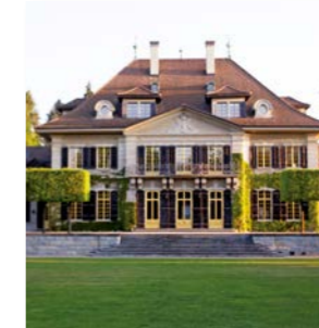
Swiss Re Centre Villa