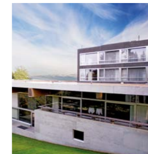
Swiss Re Centre for Global Dialogue