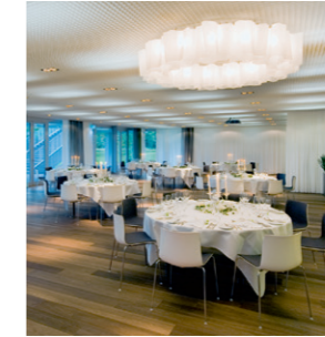
Dialog & Dinner im GDI