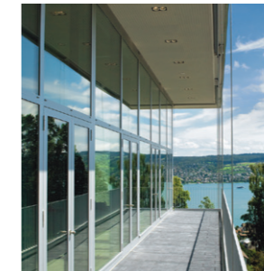
Senior Executive Konferenz im GDI