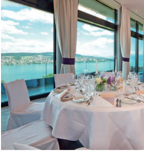
Dialog & Dinner im Hotel Belvoir