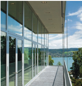
Senior Konferenz im GDI